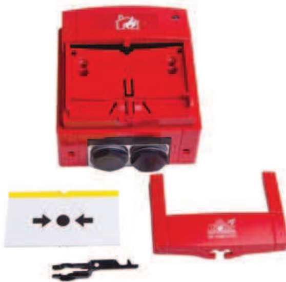
Puszka do montażu natynkowego MCP BOX